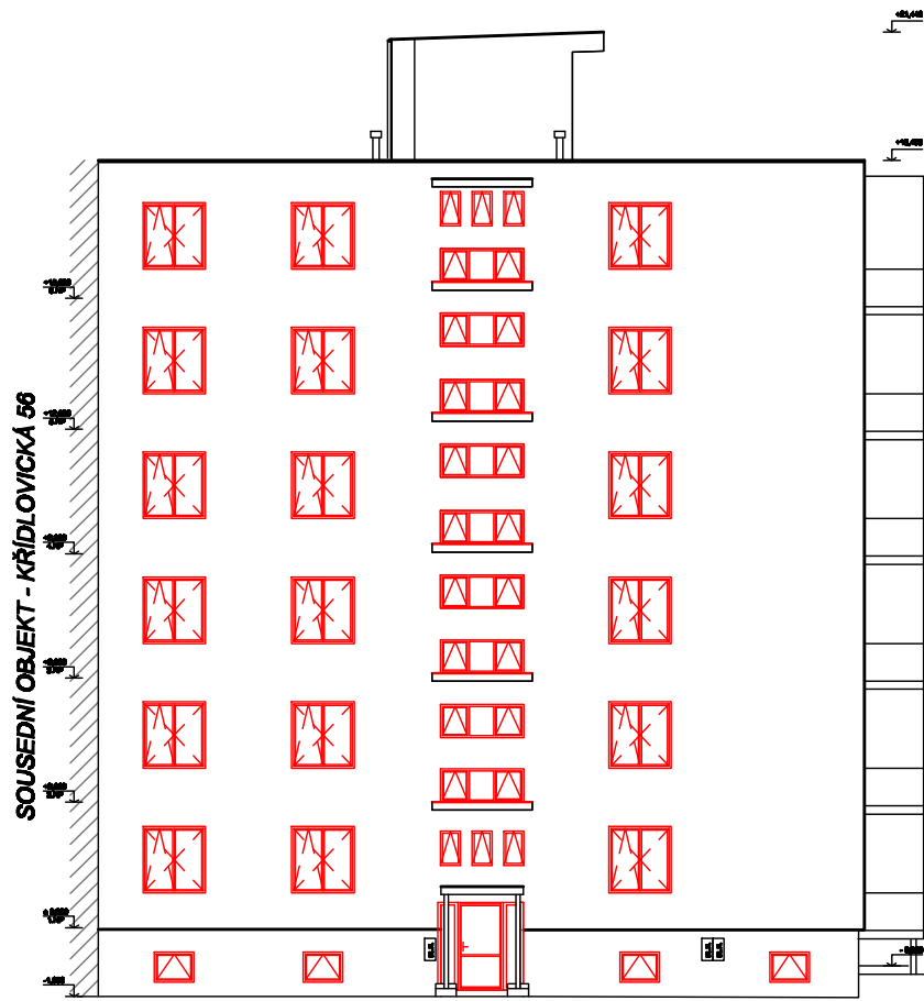
POHLED Z UL. KŘÍDLOVICKÁ